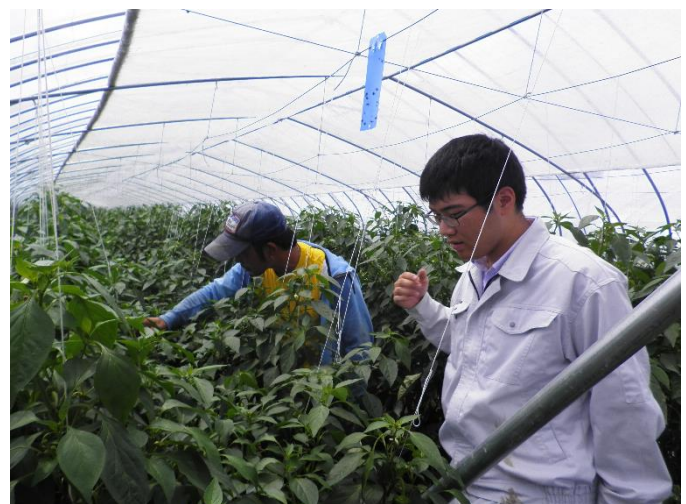
普及センターによる新規就農者への栽培支援

にいかっぶピーマンは、昭和55年に5戸の農家で生産を始めました。当初は、栽培技術や経験が少なかったことから、九州まで訪問し、先進産地の技術を勉強してきました。また大きな気象災害も乗り越えて、現在では北海道ナンバーワンの産地となりました。