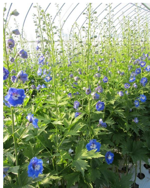
写真2: エラータム系デルフィニウム