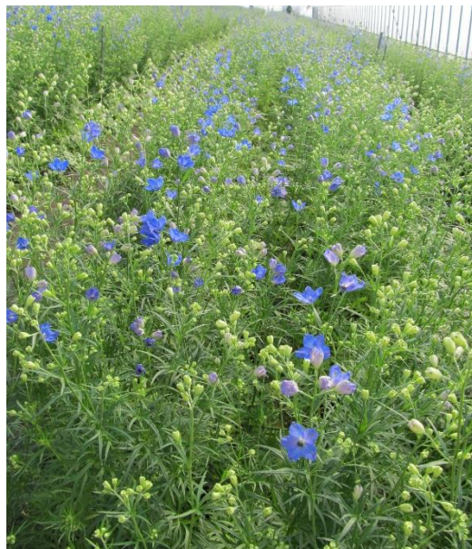
写真1: シネンシス系デルフィニウム

みついし花き振興会では、主にシネンシス系(スプレータイプ)、エラータム系(八重系タイプ)を生産しています。シネンシス系が販売額の75%(R3年)となっています。