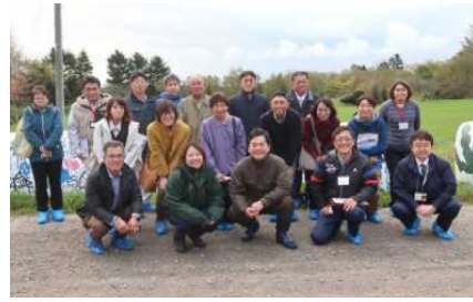
現地研修会の開催