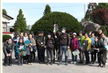
牧場研修会の実施