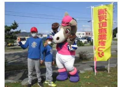
地域イベント参加協力 (浦河町4Hクラブ)