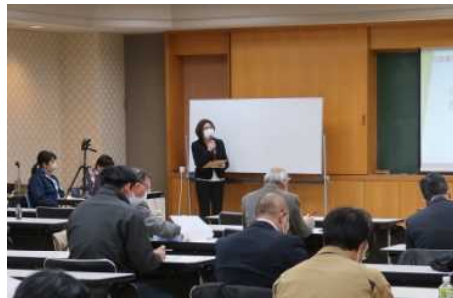
ハイブリッド配信による研修会の開催（生産農業法人会）

対面活動とWEB会議システムを併用した研修会の開催、またSNSの活用が進み、グループ運営などの意思決定の迅速化に役立っている。