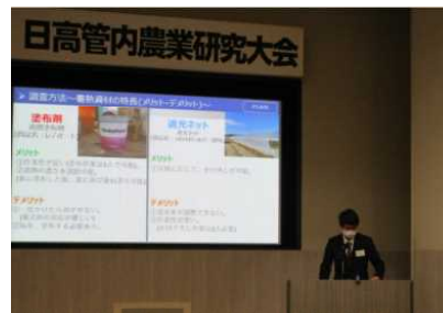
令和4年度 日高管内農業研究大会を開催