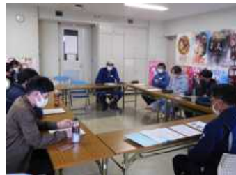
地域づくりの討論を実施

4期生6名在籍、令和5年2月には、1～4期生でディスカッションを実施した他、研修会への出席や農業研究大会に出場。