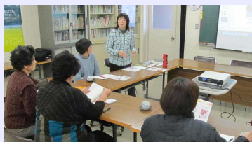
玉ねぎ作付けへの情報提供