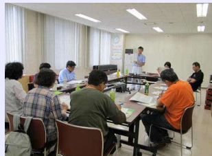
農業安全使用研修会