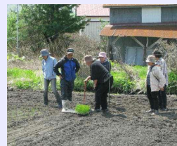
重点支援直売所生産者との交流