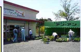
POSを導入している直売所「アツ・アツ」