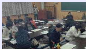
総会時出荷農業者への提案