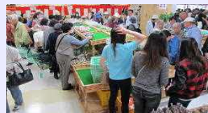
新規直売所への活動成果波及

重点支援直売所への活動成果は、高付加価値化担当者 と共有し、他の直売所への波及に努めた。