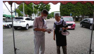
直売所代表者への情報提供