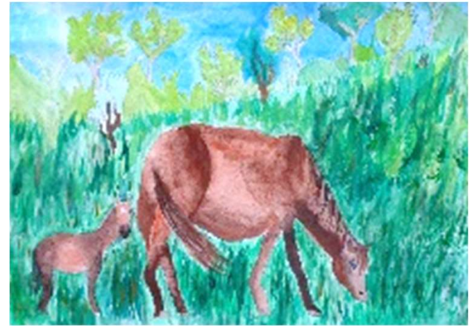
飯田 朗翔「馬の親子」