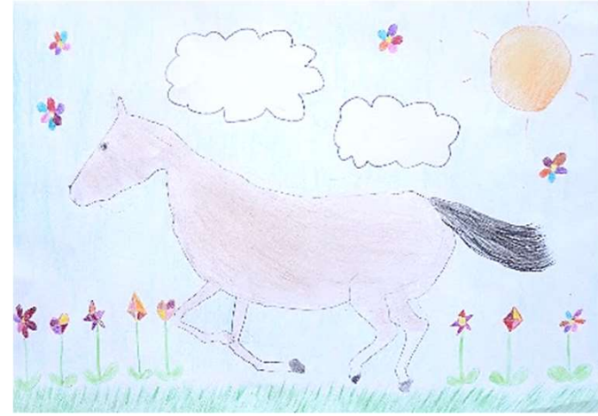
藤澤 花「お花畑を走る馬」