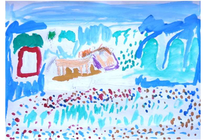
ボルジャ カイリ アビング・ミナ「うろゆうのうま」