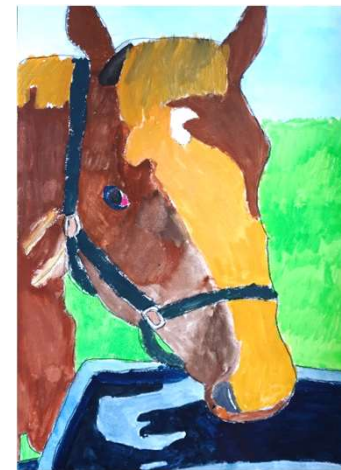
丹野 咲彩「水をのんでいる馬」