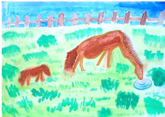
佐々木 結香「おうまのおやこ」