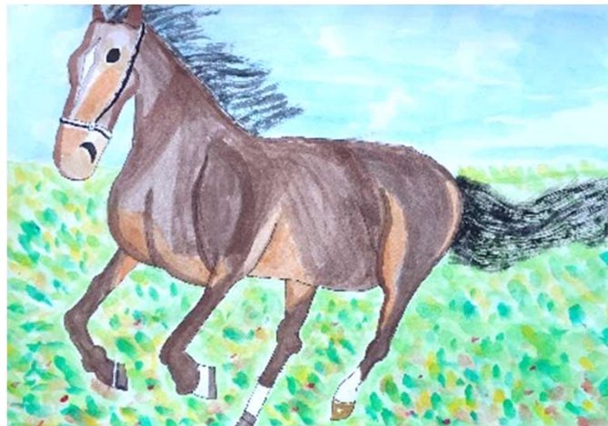
梅庭 滉歩「風を切る馬」