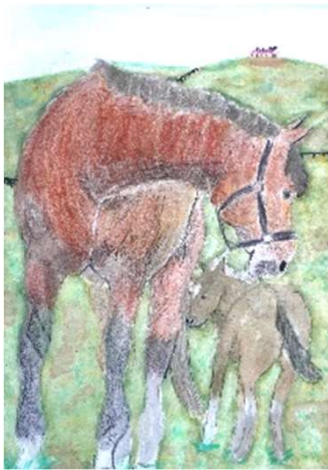
土屋 檜生「お馬の親子」