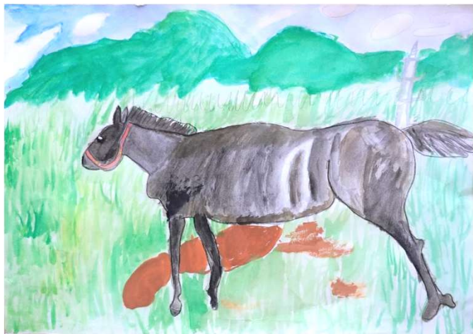
星野 うらら「はしっている馬」