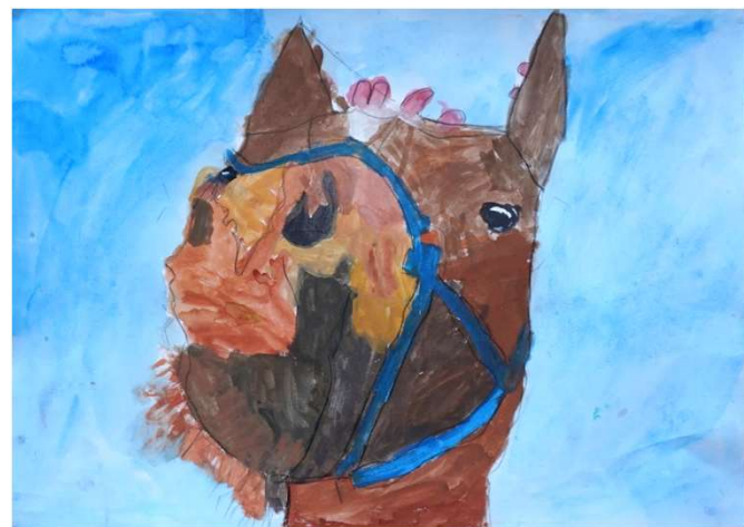
鈴木 陸斗「馬のかお」