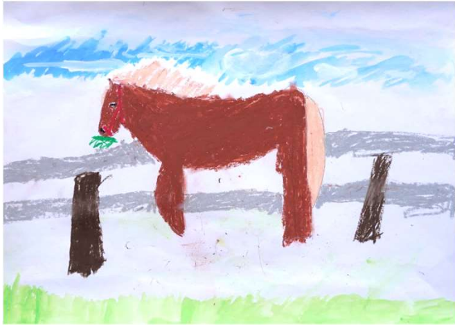
宗像 志姫「外をみてるうま」