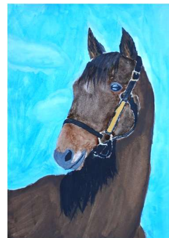
西山 晴陽「主人を待つ馬」