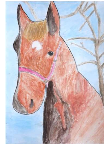
矢田 奏和「ちゃ色の馬」