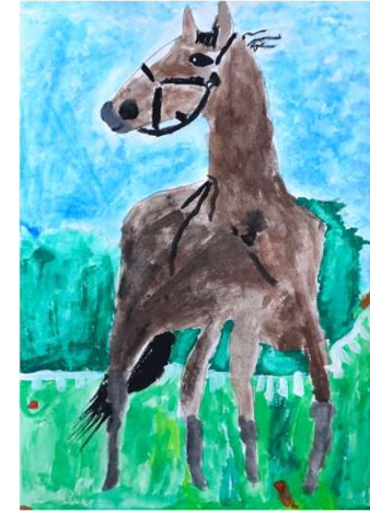
森田 奏「右を見ている馬」