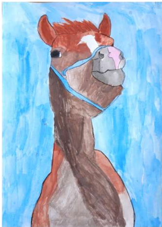
福原 唯生「左を見る馬」