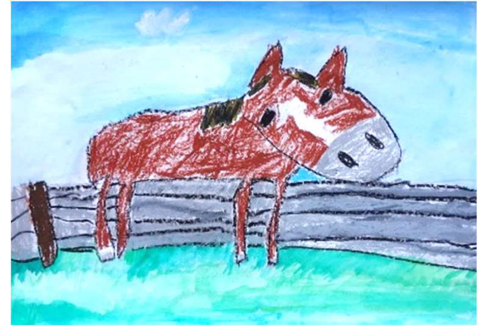
笠松 渚「こっちを見ているうまのえ」