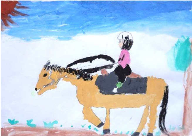
かえりやま かな「こうきにのるわたし」