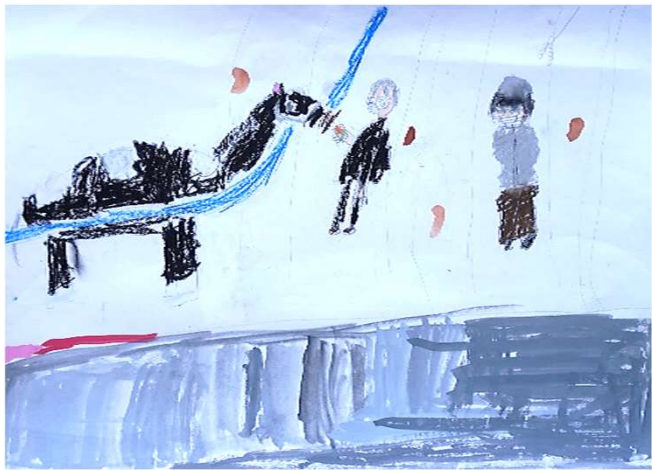
聲高 みのり「サンジの絵」