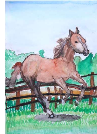
小笠原 結「草原を走る馬」