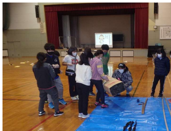
浜の担い手育成指導（青年部出前授業）