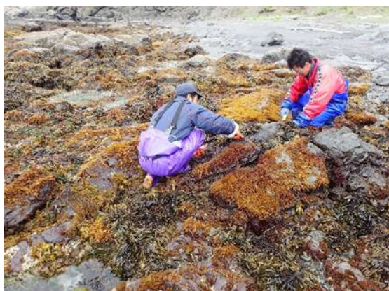
フノリ増殖指導（着生試験）