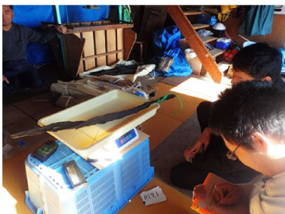
コンブ増殖指導（製品歩留調査）