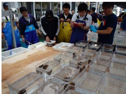
マナマコ種苗生産・放流指導（人工採卵）