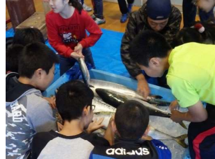
浜の担い手育成指導（青年部出前授業）