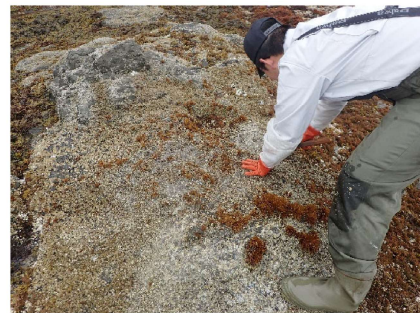
フノリ増殖指導（磯掃除・孢子撒布指導）