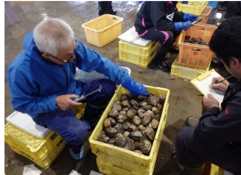
ホッキガイ資源管理指導（資源調査）