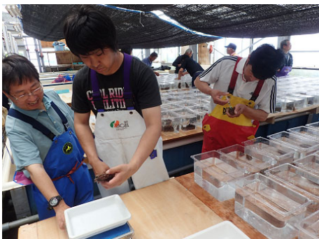
マナモコ種苗生産・放流指導（人工採卵）