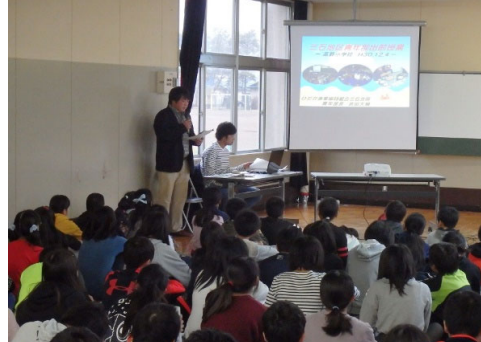
浜の担い手育成指導（青年部出前授業）