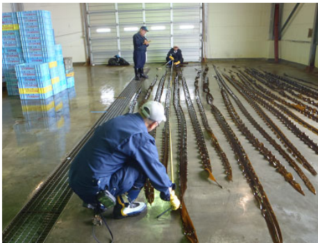
コンブ増殖指導（製品歩留調査）