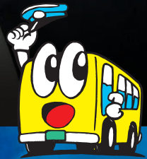
マスクキャラクター【きよたん】