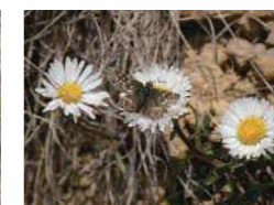
アポイアズマギクと ヒメチャマダラセセリ