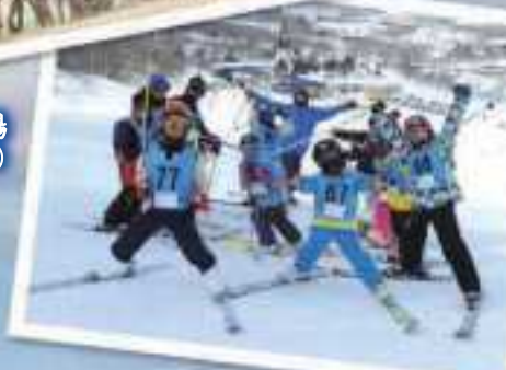
日高国際スキー場 (日高町)