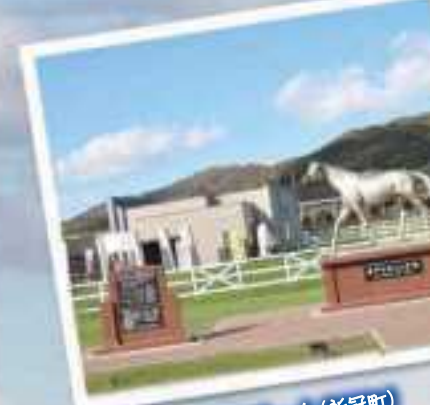
優駿メモリアルパーク (新冠町)