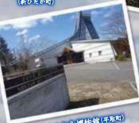
二風谷アイヌ文化博物館 (平取町)