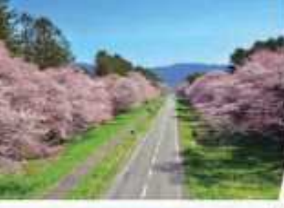
二十間道路桜並木 (新ひだか町)