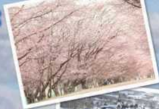
優駿さくらロード (浦河町)