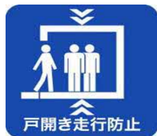
戸開走行保護装置設置済みマーク

本制度に関する詳細については、以下にお問合せください。 一般社団法人建築性能基準推進協会 電話：03-3513-7561 WEB： https://www.seinokyo.jp/