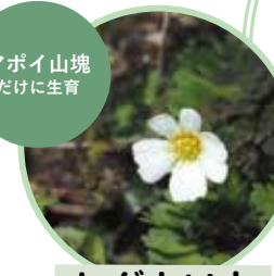
アポイ山塊 だけに生育 ヒダカソウ