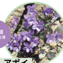
アポイ タチツボスミレ