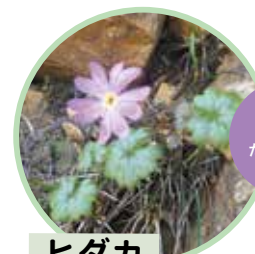
北海道 だけに生育 ヒダカ イワザクラ