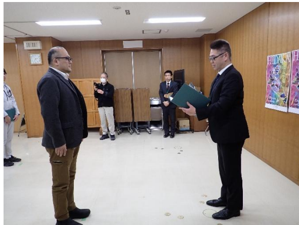
写真2（中川木育マイスター）