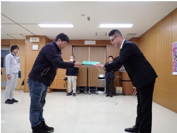
写真1（徳重木育マイスター）