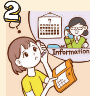
2 見学時間や条件は案内所までお問い合わせください。