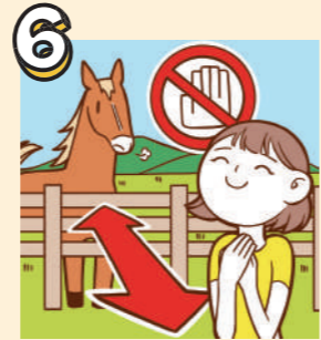
6 危険ですから馬にさわらないでください。