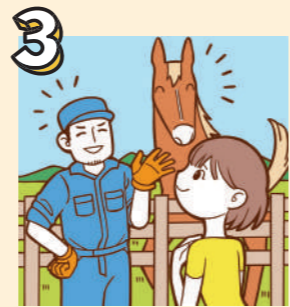
3 牧場に着いたら必ず関係者の指示に従ってください。