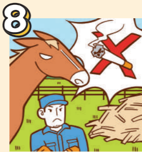
8 牧場内は禁煙です。ゴミも持ち帰ってください。