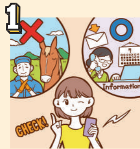
1 牧場見学はまず競走馬のふるさと案内所にお問い合わせください。