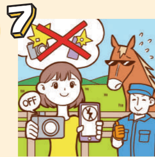
7 カメラのフラッシュ及び自撮り棒は使用しないでください。