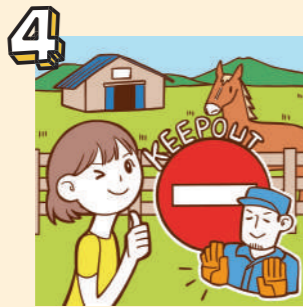
4 厩舎や放牧地は無断立入禁止です。