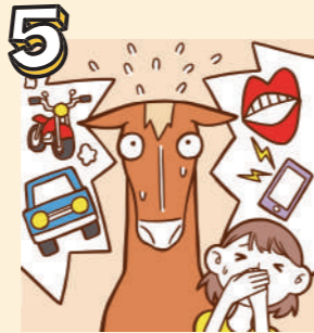
5 大きな音や声を出さないでください。携帯電話はOFFに。