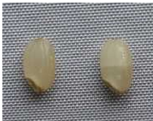
写真2 玄米品質 (左:健全米、右:胴割米)