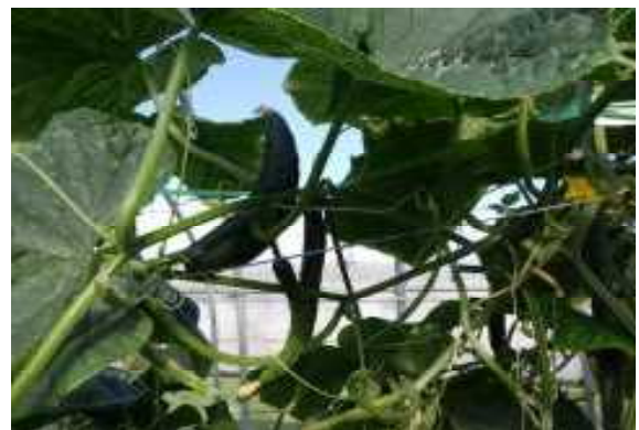
写真7 きゅうりの曲がり果