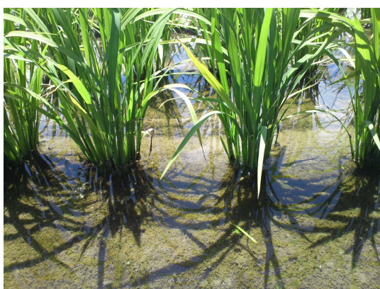
写真1 初期茎数は平年以上を確保