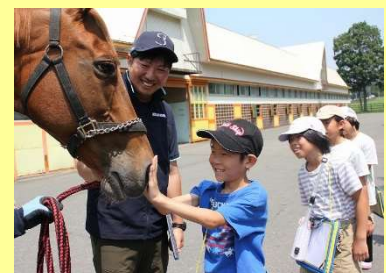
新冠小学校における馬と触れ合う体験の様子

馬産地である日高地方の特色を生かした学習や体験的な活動は、児童生徒が郷土のよさや文化に対する理解を深め、豊かな心を育むための貴重な機会となっています。