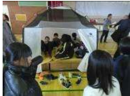
浦河町荻伏地区における「地域と学校協働の防災活動」 小・中学生と地域住民合同での防災教室の様子

また、社会教育においては、地域住民の参画や協働による地域学校協働活動、各町教委や社会教育関係団体が主催する事業を通して、心の豊かさをもたらす潤いのある地域づくりに取り組んでいます。