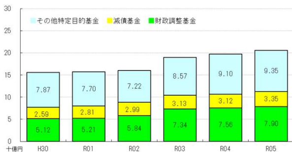
■積立金現在高の推移