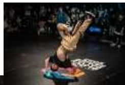
▲ブレیکنパフォーマンス