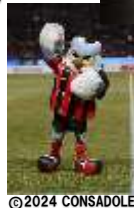
◀北海道コンサドーレ札幌 クラブマスコット「ドレーくん」が 少年の主張表彰式に登場