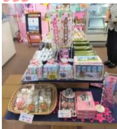
店外からも商品が見えるように