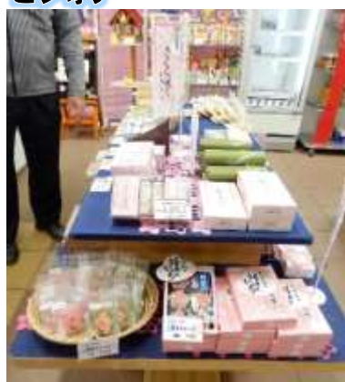
平置き中心のディスプレイ