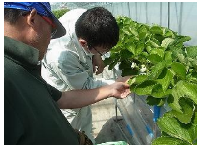
普及センターによる栽培技術支援

JA ひだか東管内は有数の競走馬の産地ですが、高齢化・後継者不足が深刻でした。そこで、町・JA・普及センターが中心となり、ケーキ用いちごによる新規参入を勧めてきました。町はリース方式によるいちごハウス団地の設置を支援、JAは収穫されたいちごを選果・パッケージする共同選果場を整備、普及センターはいちご栽培技術の習得を支援した結果、地域に活気が蘇るまでになったのです。