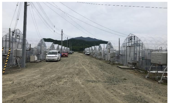
町営のいちごハウス団地