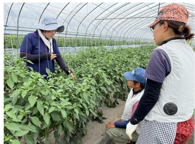
普及センターによる新規就農者への栽培支援

にいかっぶピーマンは、昭和55年に5戸の農家で生産を始めました。当初は、栽培技術や経験が少なかったことから、九州まで訪問し、先進産地の技術を勉強してきました。また大きな気象災害も乗り越えて、現在では北海道ナンバーワンの産地となりました。