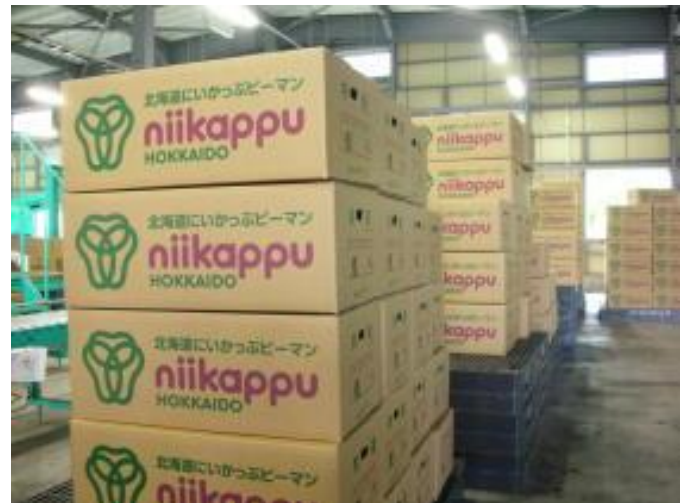
出荷を待つ にいかっぶピーマン