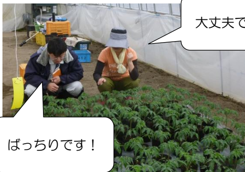
写真1 若手農家と苗の状態を確認中

JAびらとり（平取町・日高町）は、施設栽培による道内一のトマト産地です。雪が少なく比較的温暖な気候を活かし、3月から定植を始め、5～11月まで出荷しています。また、平取町には「トマトを作りたい！」と志し、農家となった若い人が多く、ベテラン農家から若手農家まで、みなさん、一生懸命おいしいトマトを作っています！