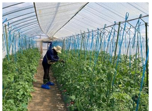
写真3：普及センターによる生育状況調査