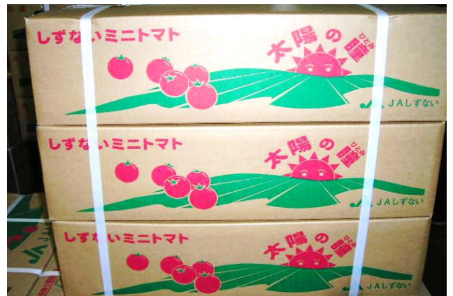
写真2：出荷を待つ「太陽の瞳」(JAしずくない)