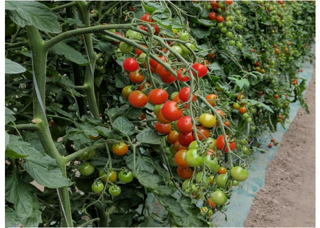
写真1：真っ赤に実ったミニトマト