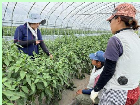
写真 就農1年目フォローアップ