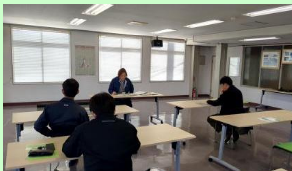
写真 農業支援員冬期座学