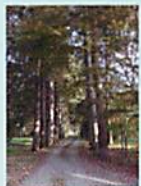
往Munro纪念馆路上的夹道树木

博士于1932年从轻井泽移居二风谷,隔年新建了自己的房子。平日除了替地方居民看诊外,还致力于爱奴民族的研究,为后世留下了丰硕的研究成果。