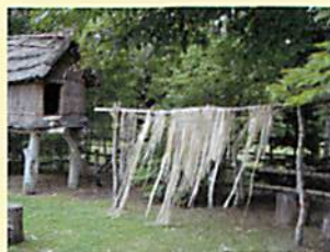
用Kuma(晾干)晒Nipes(截树的树皮)的情景