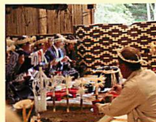
祈求 Cip-sanke 的安全所展开的 Kamuy-nomi (向神祈求的仪式)