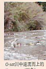
O-sat(川中逆流而上的 Kamuy-cep(鲑鱼))