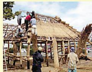
以传统技术传承为目的, Cise (家)的兴建工程