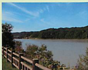
二风谷湖右岸广阔无际的「町民之森」

随着季节迁移,变化万千的沙流川河水,孕育出爱奴文化,传达给后世北海道悠久的历史。