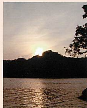
太阳西沉于 Opus-nupuri (缺口的山): 夏至的夕照