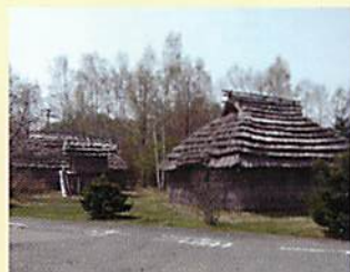
复原的 Cise (家)建筑群