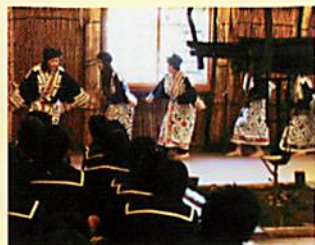
传承下来的爱奴传统舞蹈