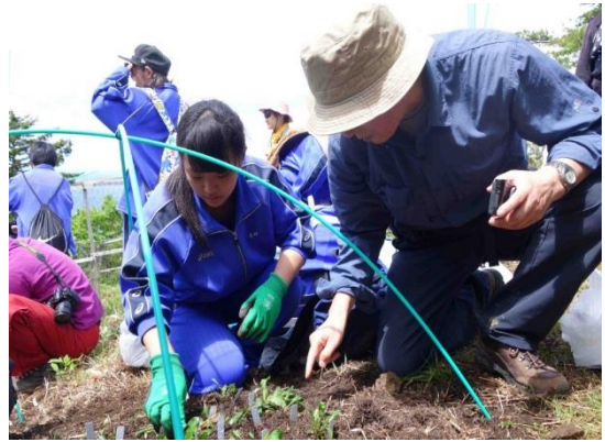
様似町立様似中学校における「アポイドリームプロジェクト」アポイ岳への高山植物の苗の植え替えの様子

また、社会教育においては、地域住民の参画や協働による社会教育活動をとらして、心の豊かさをもたらす潤いある地域づくりに取り組んでいます。