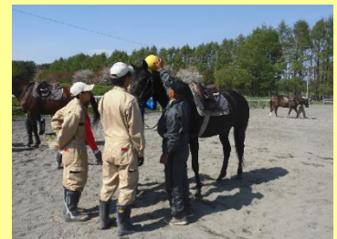
北海道静内農業高等学校における「馬利用学」の様子

馬産地である日高地方の特色を生かした学習や体験的な活動は、児童生徒が郷土のよさや文化に対する理解を深め、豊かな心を育むための貴重な機会となっています。