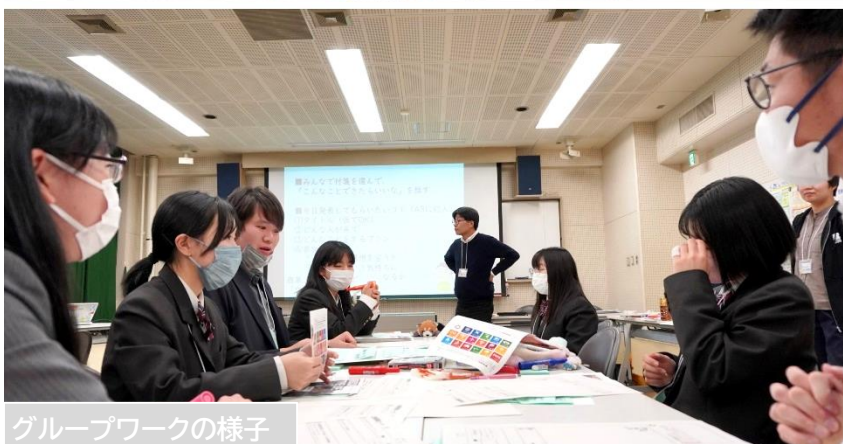
グループワークの様子