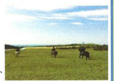
トレッキング風景