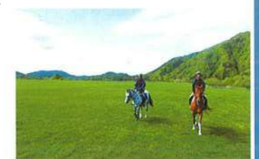
トレッキング風景