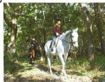
トレッキング風景