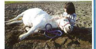
馬とのコミュニケーション風景