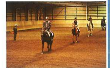
施設でのレッスン風景