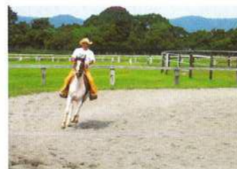
乗馬レッスン風景