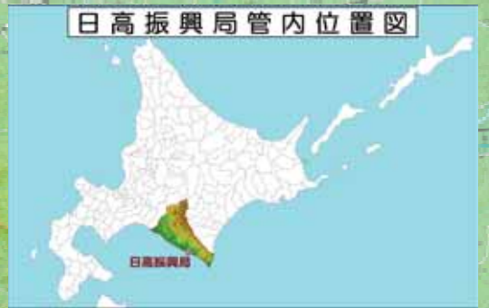
日高振興局管内位置図