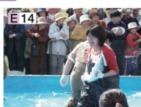
えりもの灯台まつり

E 14 襟裳山珍海味美食节 将襟裳的特产品集一堂的节庆活动。最受欢迎的是“赤手抓鲑鱼”(能抓多少给多少)活动。在快乐抽奖会里还准备了“抛年糕”活动。10月的第1个星期日举行。 〈问询〉襟裳町役场产业振兴课/ 电话(01466)2-2111