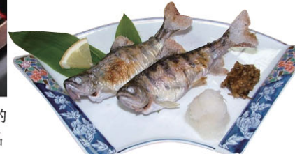
山女魚(やまめ、やまめ)

真鲱鱼是只有在山林深处的清流里才能生长的敏感鱼类。流经日高町日高地区及平取町的“沙流川”上游进行着真鲱鱼的养殖。日高地区的饮食店可以让您品尝盐烤、煎炸烹制的新鲜真鲱鱼料理。