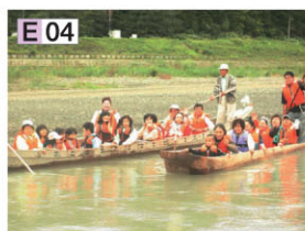
びらとり沙流川まつり

E 04 Chipsanke (独木舟下水仪式) 阿伊努人们的传统活动之一，向用传统技艺所造的独木舟(Chip)注入魂魄的新船下水传统仪式，一般游客也能乘坐独木舟。8月下旬举行。 〈问询〉Chipsanke实行委员会/ 电话(01457)2-2223