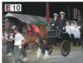
うらかわ桜まつり

E 10 浦河庆马大会 是产马之地特有、别处不可媲美的节庆活动。在此大会里将在全国范围内征集情侣进行“纯血马上婚礼”，还有牧场主们所办的“草赛马”(非公营的地方性赛马)活动。 〈问询〉浦河町役场水产商工观光课/ 电话(0146)26-9014