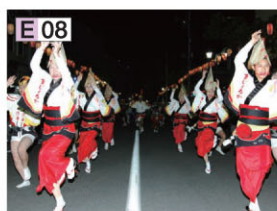
みつし蓬莱山(ほうらいせん)まつり

E 08 新日高仲夏节 7月下旬在町里将有“阿波舞”的传统舞蹈队伍沿街游行表演，“和太鼓”震撼的演奏声也将传遍大街小巷。8月中旬还有“焰火大会”及“盂兰盆会”将夏天的新日高町装扮得多姿多彩。 〈问询〉新日高町役场经济部商工劳动观光课 静内厅舎/电话(0146)43-2111