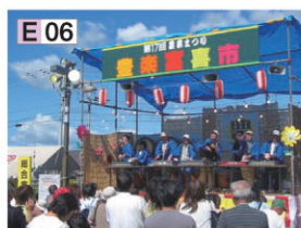
にいかつぶふるさと祭り

E 06 新冠町农业节丰乐富喜市 有新冠和牛烧烤的露天摊点和啤酒园、当地制品的销售贩卖小店，再加上“抛年糕大会”、“发票宾果游戏大会”等各种活动。8月上旬的星期六举行。 〈问询〉JA新冠营农课/ 电话(0146)47-3111