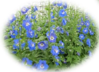
JAみつし デルフィニウム