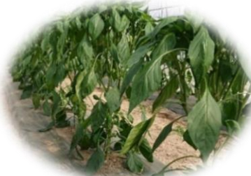
JAにいかっぷ! ピーマン