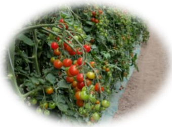
JALずない ミニトマト